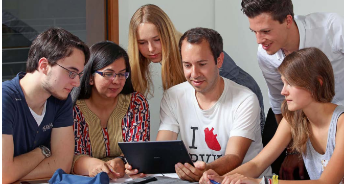
Eine Lerngruppe bei der gemeinsamen Arbeit