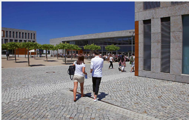
Blick über den Campus der Hochschule Fulda